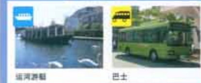
园区内交通工具介绍

●特殊节假日(黄金周、夏季节日、除夕、正月等)时因活动内容关系部分时间可能会有所变动。 ●豪斯登堡的营业时间及各设施、宾馆、商店的营业时间有所不同。 ●园区内有的设施设有休息日。请向有关人员询问。 ●在各出境处商店关门后离去时，请走出境处西侧的出口。