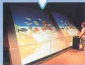
12 虚拟剧场 你画的鱼儿会在眼前的这7米×3.5米的大屏幕上畅游!