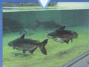
9 Pla Buk 这是世界上最大的淡水鱼,出生于泰国湄公河上游,其生态的奥秘尚未解开!