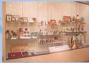
14 企鹅商品展 日本首家!快来欣赏让企鹅商品迷们激动不已的收藏品吧!