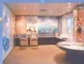
11 企鹅信息室 只要是我们的企鹅的事,无所不知,让你在一天之内就成为企鹅博士!