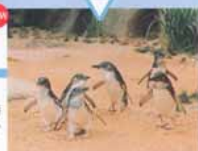
13 KOGATA企鹅 这里的饲养场与澳大利亚南部的海滨沙滩一模一样,来看看世界上最小的KOGATA企鹅吧。