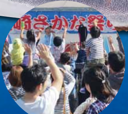
消費者参加セリ大会